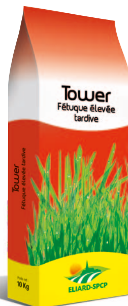
Sacherie 10 kg

Démarre tôt avec une excellente souplesse d'exploitation.