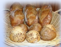
Adapté aux débouchés meuniers et alimentation animale